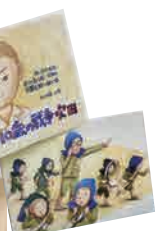
実話を元にした紙芝居