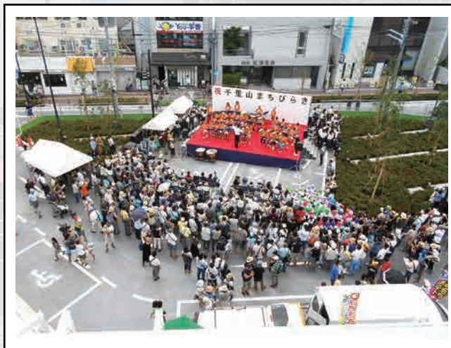
2016.9.4 まちびらきイベントに大勢の方が集まり、様々な催しが行われました。