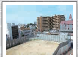
3階のコミセンから工事の様子がよく見えました。