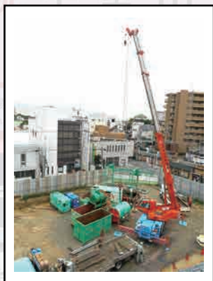
駅前ロータリーの整備とともに雨水を排除する役割を持つ公共下水道の整備が行われました。