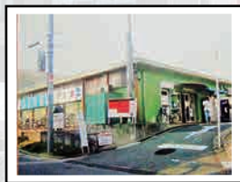
覚えていますか？千里山マーケット。

千里山駅東側の千里山マーケットを覚えていますか？跡地は皆さんご存じの通り、駅前広場へと変わりました。2016年9月には大勢の方が千里山の新しい一歩を祝うべく、千里山まちびらきイベントが行われました。