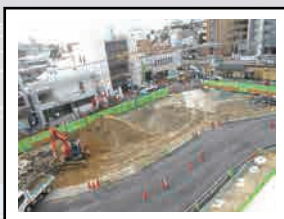
だんだん見慣れた様子に。