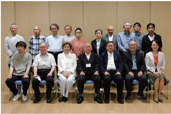
令和5年度の役員の皆様

本年度も多数の会員の皆さまにご出席頂き、令和5年度定時総会を開催致しました。来賓のご挨拶を頂いた後、総会成立が宣言され、令和4年度の事業活動・決算・会計監査報告の3議案、ならびに令和5年度の事業活動・予算(案)、役員選任(案)の3議案の計6議案について、熱心な質疑を経て、全て原案通り承認されました。