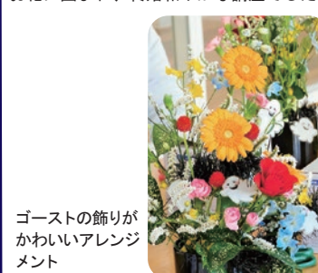
ゴーストの飾りがかわいいアレンジメント

ハロウィンをテーマにした花セラピー。今回は8種の花を黒いマグカップに生けました。自由に生けることがルールとのことで参加者の皆さんは心の赴くままに花を選び位置を決めます。あれやこれや悩む様子も楽しく、心のマッサージと称される花セラピーを通して癒しのひとときを過ごされました。