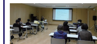
記憶は曖昧！記録が大事です。

日頃から子どもの様子を観察し、予防接種や既往歴の記録をする。そして診察時に症状と記録を的確に伝えることが大人より免疫や体力の少ない子どもを守るのだと教えて頂きました。