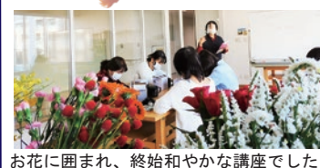
お花に囲まれ、終始和やかな講座でした

ハロウィンをテーマにした花セラピー。今回は8種の花を黒いマグカップに生けました。自由に生けることがルールとのことで参加者の皆さんは心の赴くままに花を選び位置を決めます。あれやこれや悩む様子も楽しく、心のマッサージと称される花セラピーを通して癒しのひとときを過ごされました。