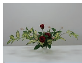
10/14 ゴッドセフィアーナ バラ・マリーサイモン