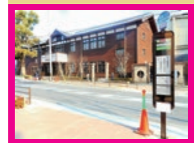
バスの停留所も設置（図書館前）

千里山佐井寺線「松が丘工区」約405mの道路が3月15日に開通しました。 事業期間8年余り、総事業費約22億8千万円で、環境やバリアフリーに配慮した舗装と電柱のないことが特徴です。 この道路の開通により、バス路線が新規導入され、3月31日から阪急千里山駅～JR吹田駅北口を結んで阪急バスが運行されます。また千二小学校前の交通量が減り、児童の皆さんも安全に登下校できますね。