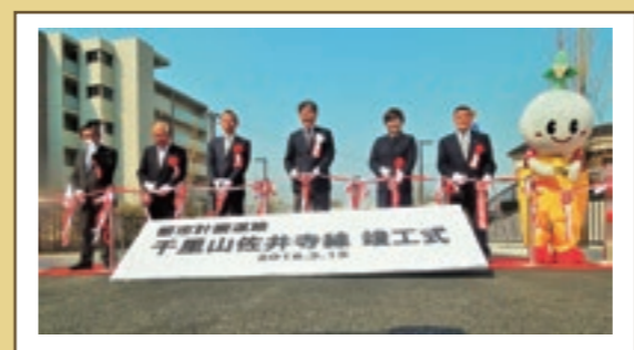
晴天の中での竣工式