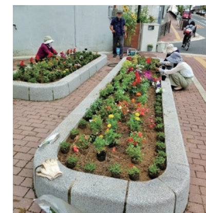
サルビア・マリーゴールドなど夏の花に衣替え