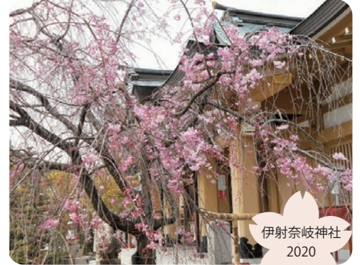
枝垂桜が立派です。

千里山は桜の名所と言われていた頃を思うと、桜の木が少なくなったことは否めませんが、身近なお花見スポットを取り上げました。枝垂桜や新たに植樹された桜の木もあり、華やかな季節に心が躍ります。