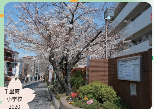
千里第二 小学校 2020