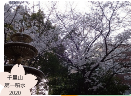
千里山 第一噴水 2020