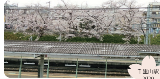
電車に乗る度見惚れます。