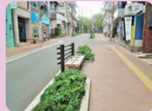
(駅から第一噴水への道) ベンチと植栽もリニューアル。歩道もきれいになりました。

千里山駅西側のスクランブル交差点の改良工事が進んでいます。歩行者にとっては横断する時間が短くなるよう、横断歩道の長さを短くし、一方、車両は減速して通行するよう、カーブをつけた道路形態となっています。この駅前の工事は6月末に完了する予定です。続いて駅に隣接する消防団千二分団詰所が約300m北に移転されます。その後、跨線橋から駅手前までの道路の歩道拡張・車道改修工事が行われます。この工事は平成30年度内に完了する予定です。これからも駅前の開発を中心とした、住む者にとってやさしい千里山の街づくりを見守っていききたいと思います。