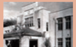
昭和 36 年の吹田市立第一中学校

ほっ と一息 電柱編 4 牛が首 千里山西六丁目にある電柱で「牛が首」というプレートのあるのを見かけます。阪急千里線の南千里駅のすぐ近くの千里南公園に、牛が首池があります。憩いの場として人気があるようですが、昔はこの辺の小字として「牛が首」がありました。名前の由来は、形が牛の首に似ているとか、日照りのときに牛の首をこの池にささげたとか、色々あります。いずれにしても、西六丁目の電柱の位置とは随分離れていて、なぜなのか首をひねるばかりです。西六丁目には商業施設のイオンがありますが、ここは吹田市立第一中学校のあったところ。体育の授業で、よく「一本松まで走れ」といわれて走ったものですが、この一本松は牛が首池辺りにありました。なんとなく関係があるような、ないような。(暁)